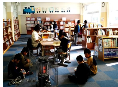
【新しい図書室でくつろぐ子どもたち】

除籍を行い、授業で使える資料がすぐわかるように並び替えを行いました。死角がないようにカウンターや本棚も大移動！先生や子どもたちにも喜んでもらえました。