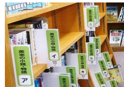
【中学校用差し込み見出し】