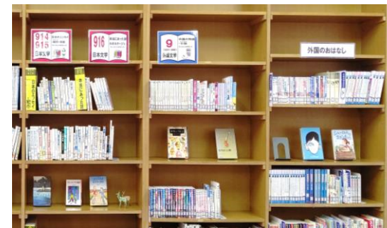
【after 大きな棚上サインと差し込み見出しをいれる。棚に余裕ができ、表紙を見せて展示ができる】

班に分かれて、ラベル貼りや見出し作りなど、細かい作業を実際に行いながら、今後自分の学校で生かすことができるスキルを紹介しました。