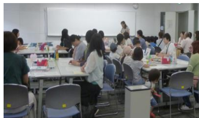
【座りきれないほどの参加者がありました】