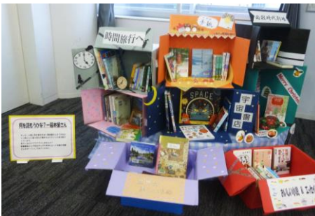
【段ボールを使ったひと箱屋さん】