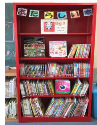
【赤いペンキを塗り新しく生まれ変わった本棚】